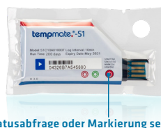
Statusabfrage oder Markierung setzen (optional)